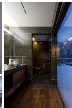
左上：リビングよりガラスに囲まれたダイニングスペースを見る。左下：上空より敷地全体を見る。右：山側に開いたユーティリティとバスルームを見る。